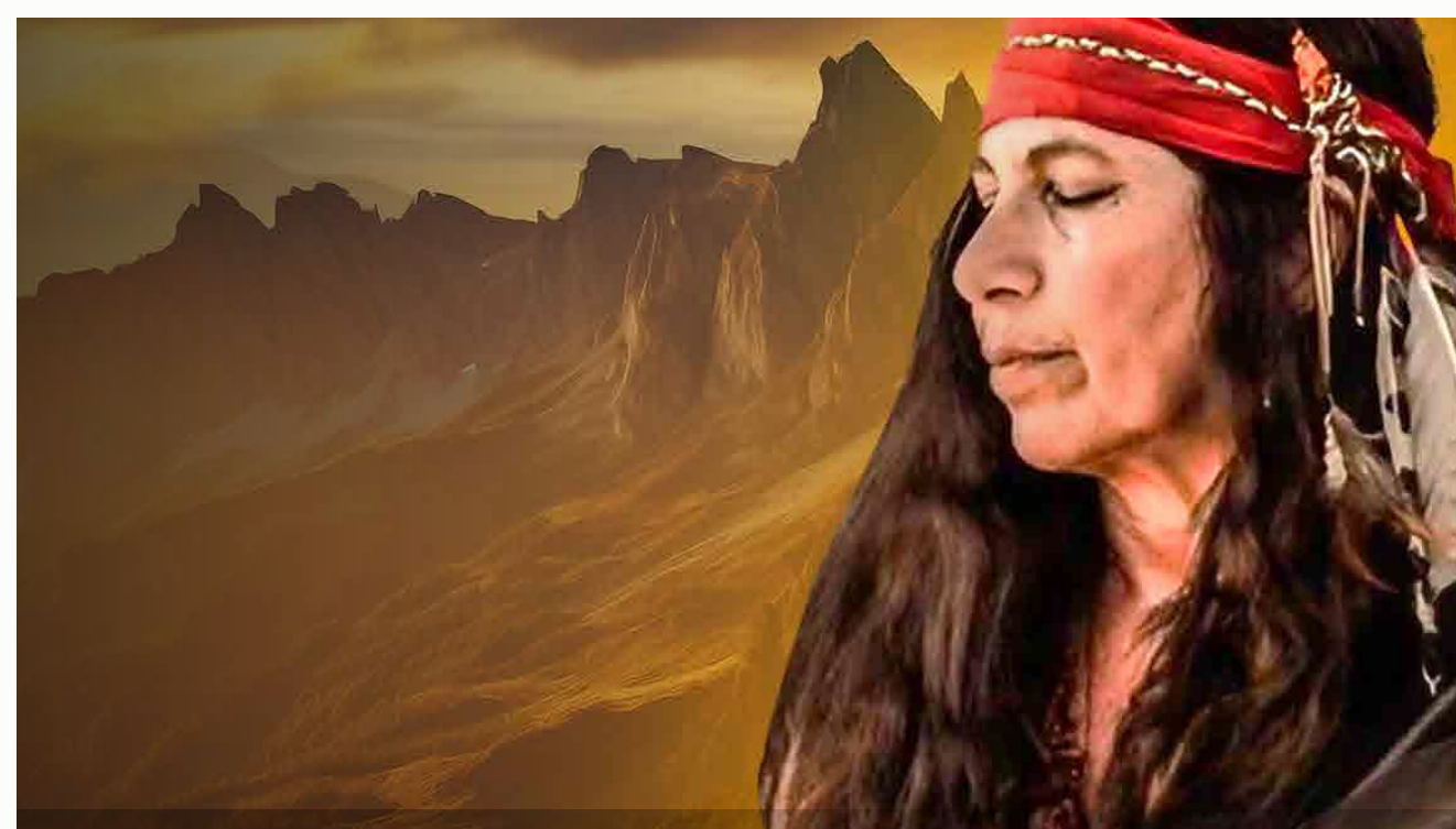
Iniciación al Chamanismo ¡Inscríbete ahora!