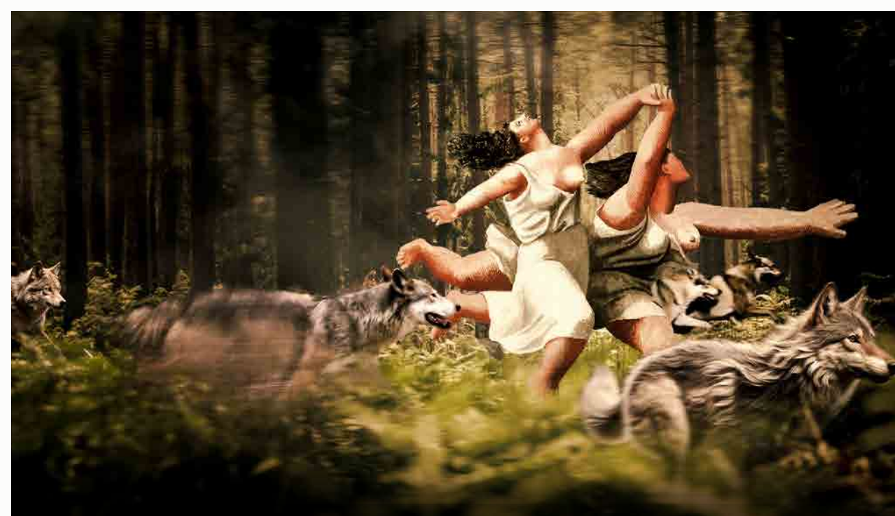
Mujeres que Corren con los Lobos ¡Inscríbete ahora!