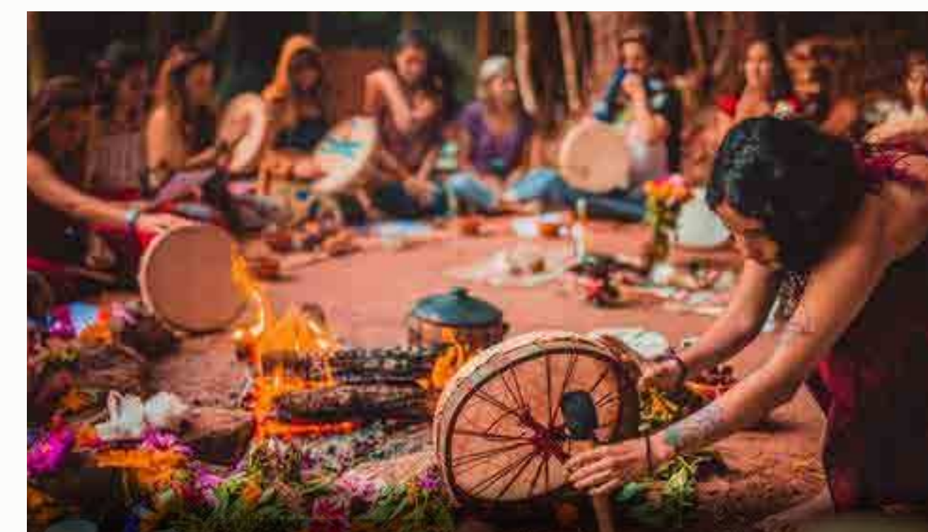
Coordinadoras Círculo de Mujeres Próximamente